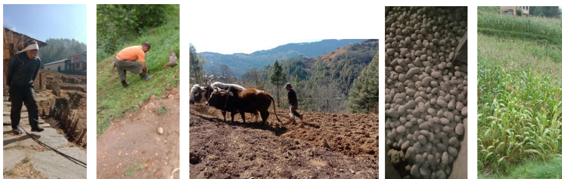
Le travail de la terre .....

« Depuis, qu'il n'y a plus de travail de guide au Népal pour accompagner les touristes, j'ai repris mon travail d'agriculteur sur les terres de ma famille. Nous n'avons aucune machine. »