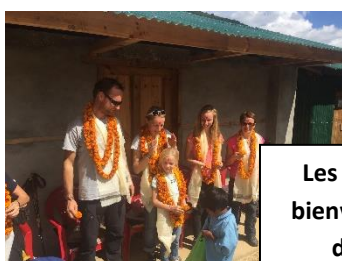
Les marques de bienvenue reçues des élèves