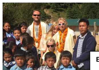
En famille dans la cour de l'école de Ghunsa