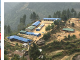
Notre ami Ngima et l'école de Ghunsa son village

5 mois depuis notre « Namasté Ghunsa » n°3 de décembre dernier et à nouveau beaucoup d'évènements depuis.