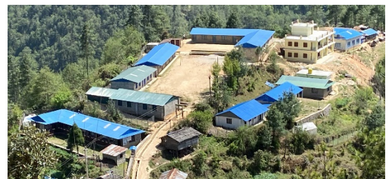
Evolution du site de l'école et du dispensaire