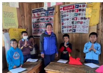
Classe de niveau 5 (CM2 pour nous)